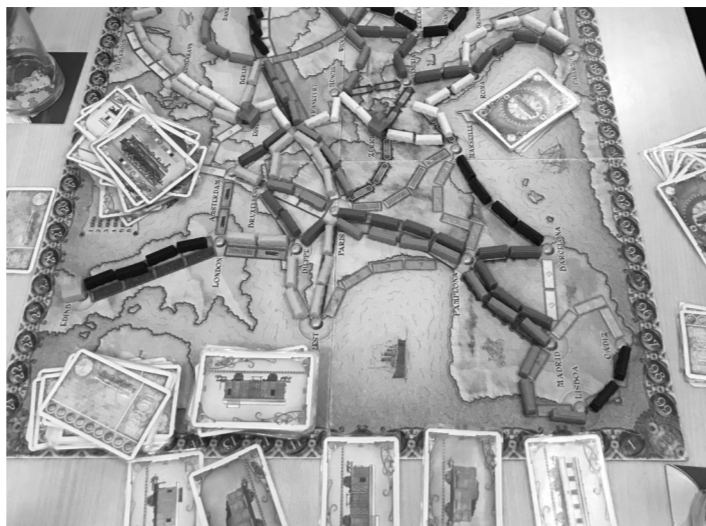
Playing Ticket To Ride Europe in Dobra poteza.