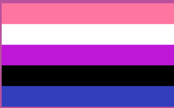
Zastava spolno fluidnih (genderfluid) oseb